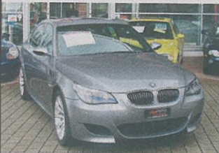
BMW M5 4. 2005, silbergrau met., 36 000 km, Navigationssystem, Park Distance Control usw., Fr. 79 800.-