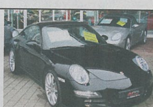
Porsche 911 Carrera 2006, schwarz met., 56 000 km, Navigationssystem, Tempomat, Leder-Ausstattung usw., Fr. 79 800.-