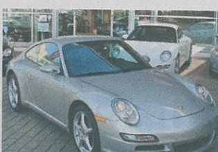
Porsche 911 Carrera 11. 2004, silber met., 35 000 km, Navigations- system, CD-Wechsler, Tempomat, Leder usw., Fr. 79 800.-