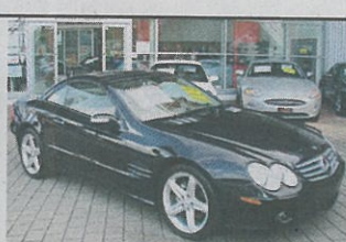
Mercedes-Benz SL 500 Cabriolet 2005, blau met., 73 000 km, Holzapplikationen, Lenkrad in Leder und Holz, Alufelgen usw., Fr. 69 800.-