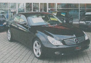
Mercedes-Benz CLS 350 6. 2006, obsidianschwarz met., 48 000 km, Leder- Paket, Aluräder, Bi-Xenon-Lichtanlage usw., Fr. 73 900.-