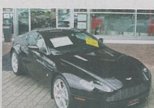
Aston Martin V8 Vantage 4.3 11. 2006, schwarz met., 25 000 km, Navigations- system, Diebstahlwarnanlage, Leder usw., Fr. 119 800.-