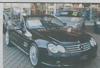
Mercedes-Benz SL 55 AMG 2002, schwarz met., 108 000 km, Radionavigationssystem, CD-Wechsler usw., Fr. 69 800.-