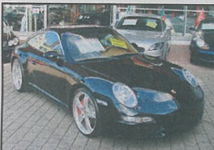
Porsche 911 Carrera 4S Targa 4x4 2008, schwarz, 13 000 km, Navigationssystem, Leder-Ausstattung, Tempomat usw., Fr. 129 800.-