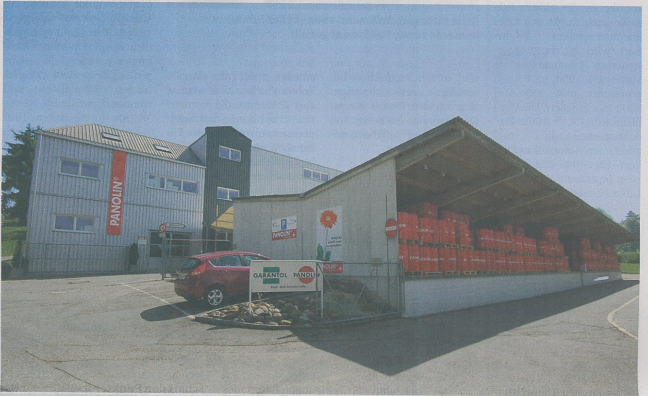
Hightech-Betrieb Panolin: Ölproduktion im Zürcher Oberland.

1966 beginnt Lämmle mit einer eigenen Produktion am heutigen Standort, bereits im Alter von 17 Jahren tritt