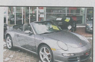
Porsche 911 Carrera 4 Cabrio 4x4 2006, seelgrau met., 56 000 km, Tempomat, Leder- Ausstattung, Alufelgen usw., Fr. 96 800.-