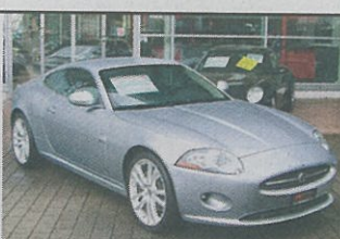
Jaguar XK 4.2 V8 2007, silber met., 12 000 km, DVD-Navigationssystem, Tempomat, Bordcomputer usw., Fr. 76 900.-