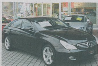
Mercedes-Benz CLS 500 12. 2005, obsidianschwarz met., 69 000 km, Navigationssystem, CD-Wechsler usw., Fr. 69 800.-