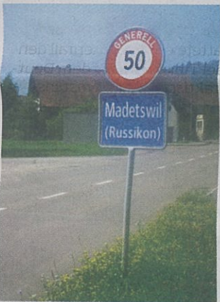
Von Madetswil exportiert das Unternehmen in die ganze Welt.

In der Schweiz wird seit Jahrzehnten vergeblich nach Erdöl gesucht, sie ist arm an Rohstoffen. Und Madetswil im Zürcher Oberland ist dort, wo sich Füchse und Hasen gute Nacht sagen und wo kein Fenstersims ohne Geranien bleibt. Aber von Madetswil aus, einer sogenannten Ausenwacht auf dem Gebiet der 4000 Einwohner starken Gemeinde Russikon, werden täglich Ölbehälter in die ganze Welt – bis nach Australien – verschickt. Schmierstoffe, die irgendwo auf der Welt gefördert, dann in Madetswil veredelt und hernach wiederum auf dem ganzen Erdball verkauft werden.